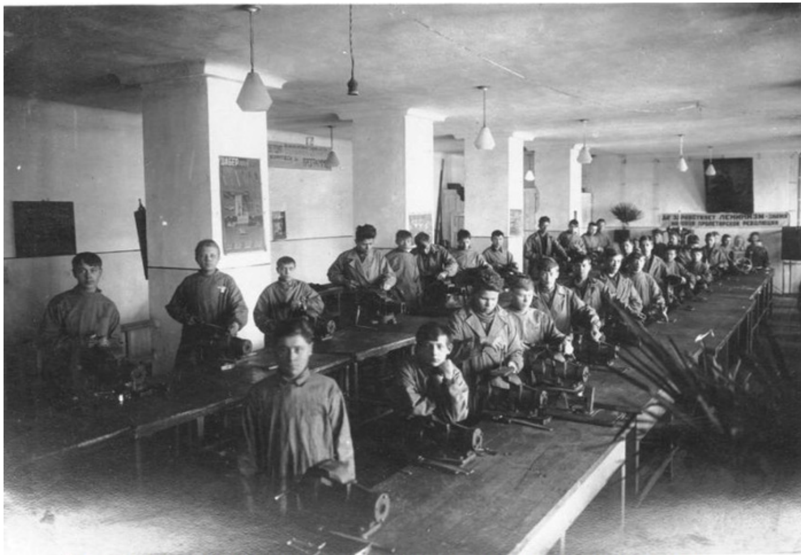
Слесарная учебно-производственная мастерская школы ФЗУ завода Уралэлектромаш. Свердловск, 1935 год.

Отдел профессионального образования объединил все профессиональные школы, содержание и методы обучения.